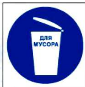
M16 Для мусора