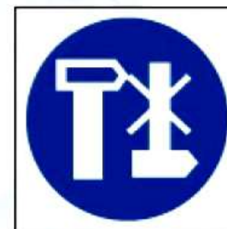
M18 Работать инструмен- том, не дающем искры