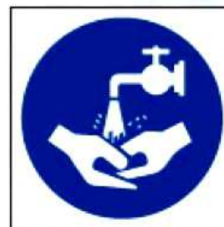
M17 Мыть руки