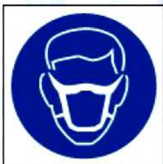
M20 Работать в защитной повязке