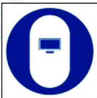
M21 Работать в сварочном щитке