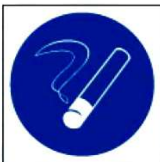
M15 Курить здесь