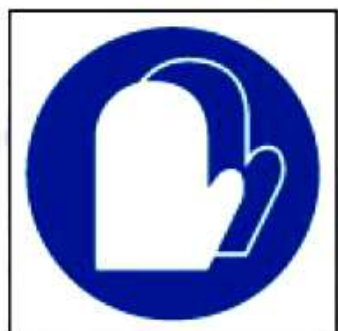
M19 Работать в защитных перчатках (рукавицах)