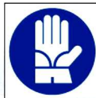
M23 Работать в диэлектрических перчатках