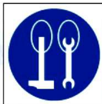
M22 Работать на высоте с привязанным ручным инструментом