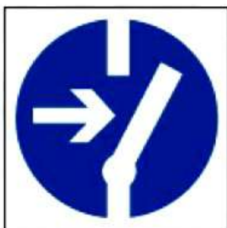
M14 Отключить перед работой