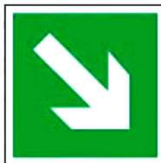
E02-02 Направляющая стрелка под углом 45°