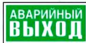
E26 Указатель аварийного выхода