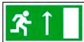
E11 Направление к эвакуационному выходу прямо

СТОРОНЫ ПРЯМОУГОЛЬНИКА (ММ): 100x200; 150x300