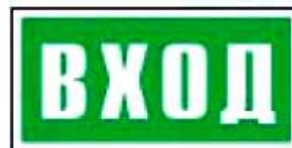
E25 Указатель входа