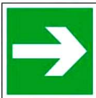
E02-01 Направляющая стрелка