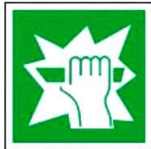
E17 Для доступа вскрыть здесь