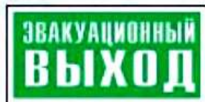
E24 Указатель эвакуационного выхода