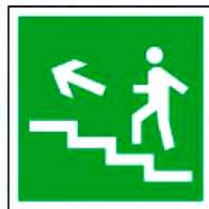
E16 Направление к эвакуационному выходу по лестнице вверх