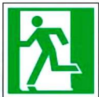
E01-01 Выход здесь (левосторонний)

СТОРОНА КВАДРАТА (ММ): 100x100; 150x150; 200x200; 250x250; 300x300 СТОРОНЫ ПРЯМОУГОЛЬНИКА (ММ): 100x200; 150x300