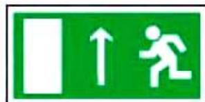
E12 Направление к эвакуационному выходу прямо