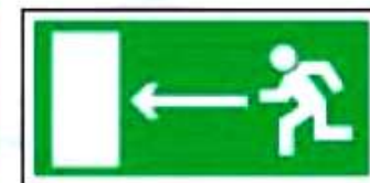
E04 Направление к эвакуационному выходу налево