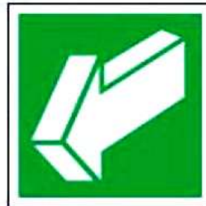
E19 Открывать движением на себя