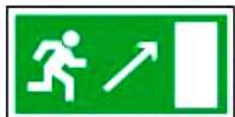
E05 Направление к эвакуационному выходу направо вверх