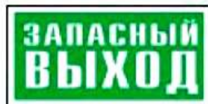
E23 Указатель запасного выхода