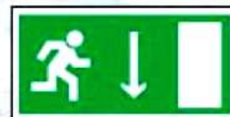
E09 Указатель двери эва- куационного выхода (правосторонний)