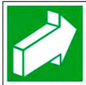
E18 Открывать движением от себя