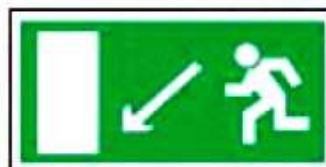
E08 Направление к эвакуационному выходу налево вниз