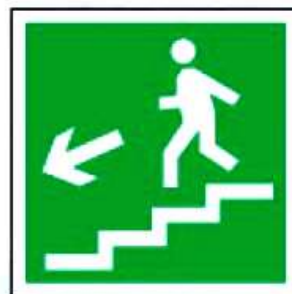
E14 Направление к эвакуационному выходу по лестнице вниз