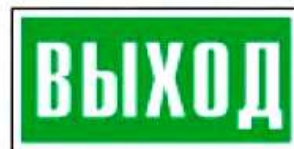
E22 Указатель выхода