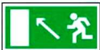
E06 Направление к эвакуационному выходу налево вверх