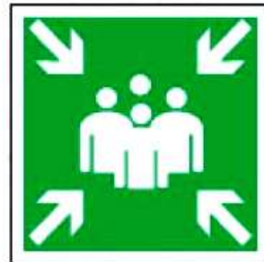
E21 Пункт (место) сбора