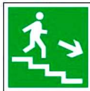
E13 Направление к эвакуационному выходу по лестнице вниз