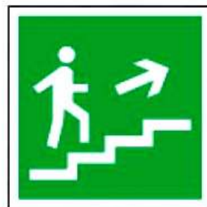
E15 Направление к эвакуационному выходу по лестнице вверх