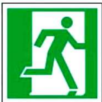
E01-02 Выход здесь (правосторонний)