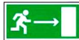
E03 Направление к эвакуационному выходу направо