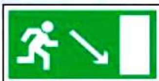
E07 Направление к эвакуационному выходу направо вниз